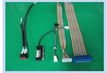
コネクタケーブル