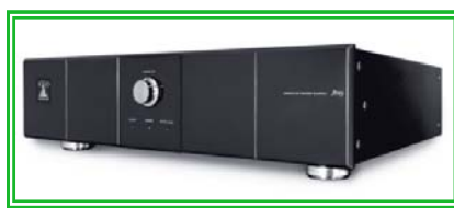
オーディオ機器 フロントパネル