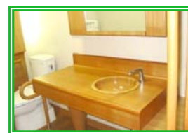
手洗いカウンター&手洗器