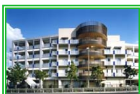
芦屋高級老人ホーム