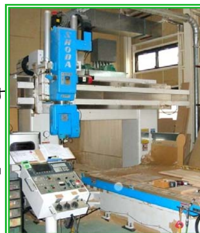
5軸同時制御 NCルーター