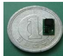
世界最小昇圧回路